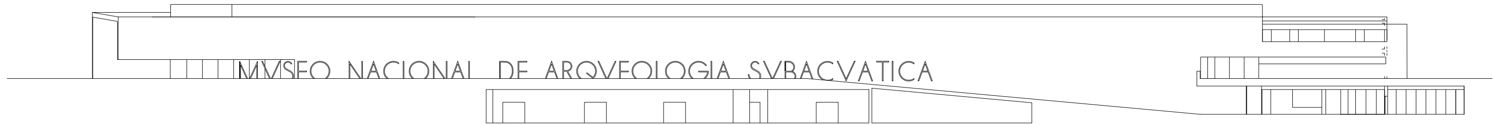
SECCION POR LA RAMPA