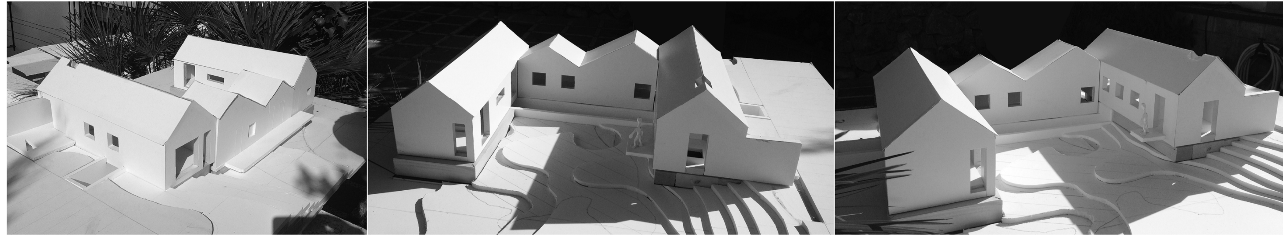
Imágenes MAQUETA DE ESTUDIO