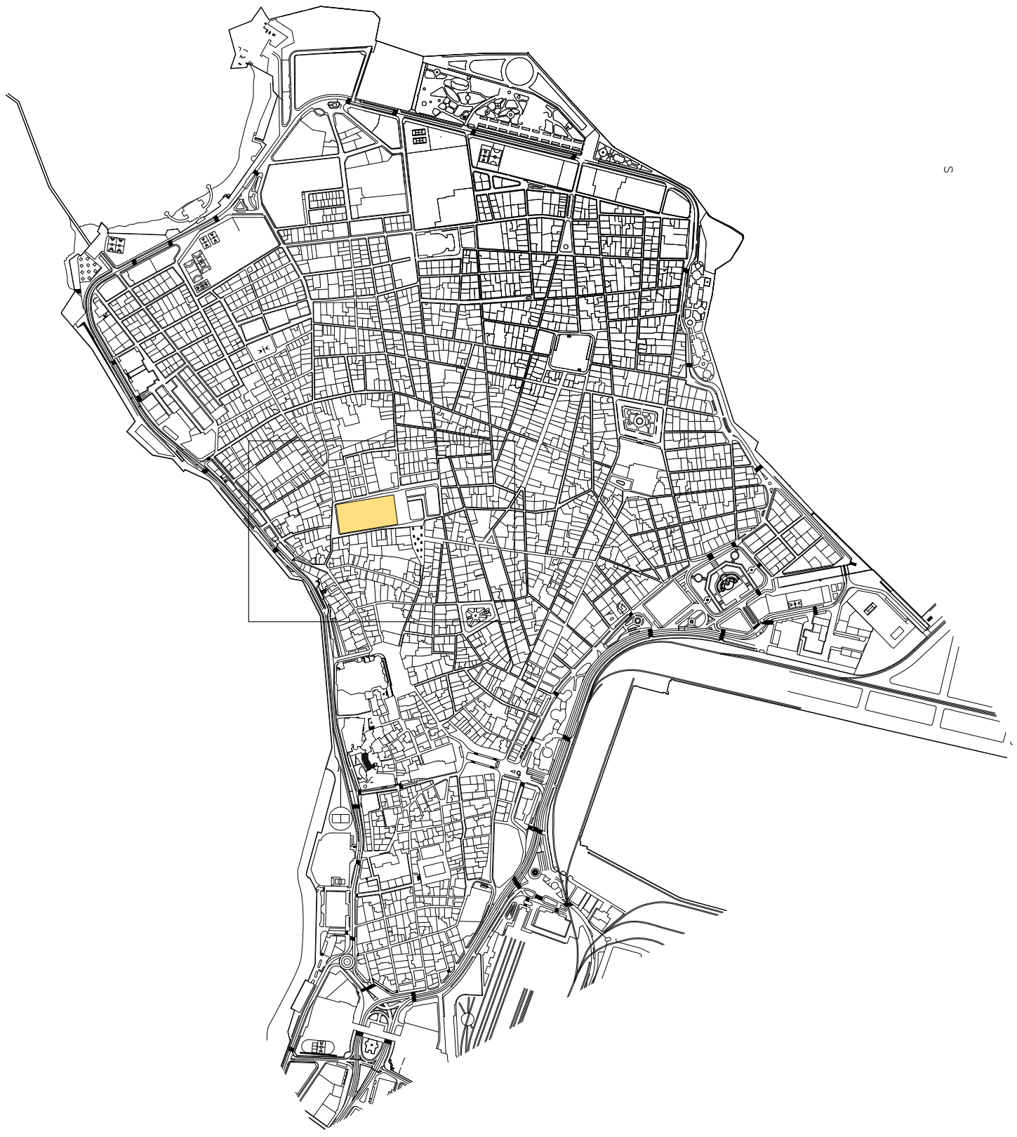
PLANO DE LOCALIZACION GEOGRAFICA — E : 1/10.000