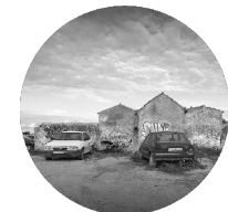
Fachada este previa a la intervención 2011