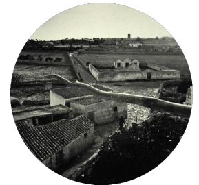
Cementerio y alrededores 1962