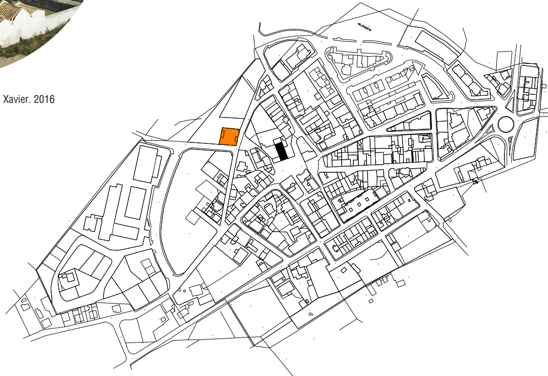
Emplazamiento. Sant Francesc Xavier e. 1:5000