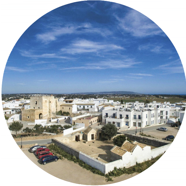
Cementerio y pueblo de Sant Francesc Xavier. 2016