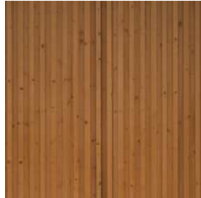
MADERA DE PINO Y TABLERO TRICAPA CARPINTERÍA EXTERIOR Y MOBILIARIO