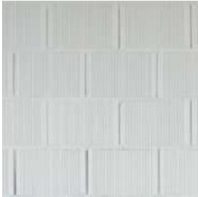
BLOQUE CERÁMICA TERMOARCILLA 30x29x19CM MURO ESTRUCTURAL