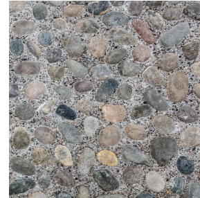
ÁRIDO DE RIO D: 10/20-40/60-80/120MM PAVIMENTO EXTERIOR