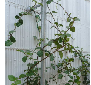
VEGETACIÓN CADUCA:BUGANVILIA-PLATANEROS CONFORT TÉRMICO EXTERIOR