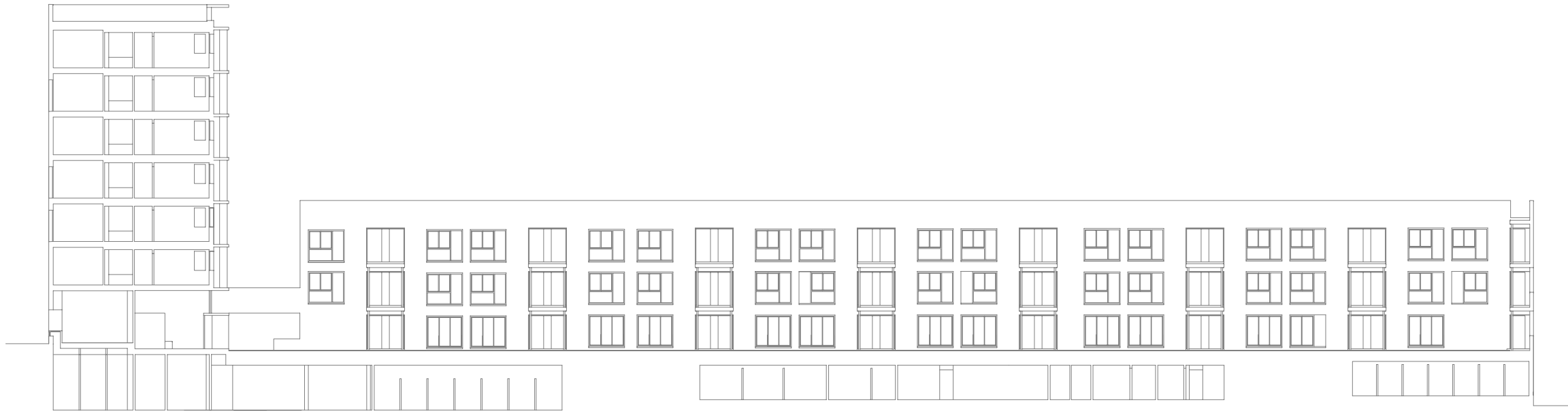
sección por patio.